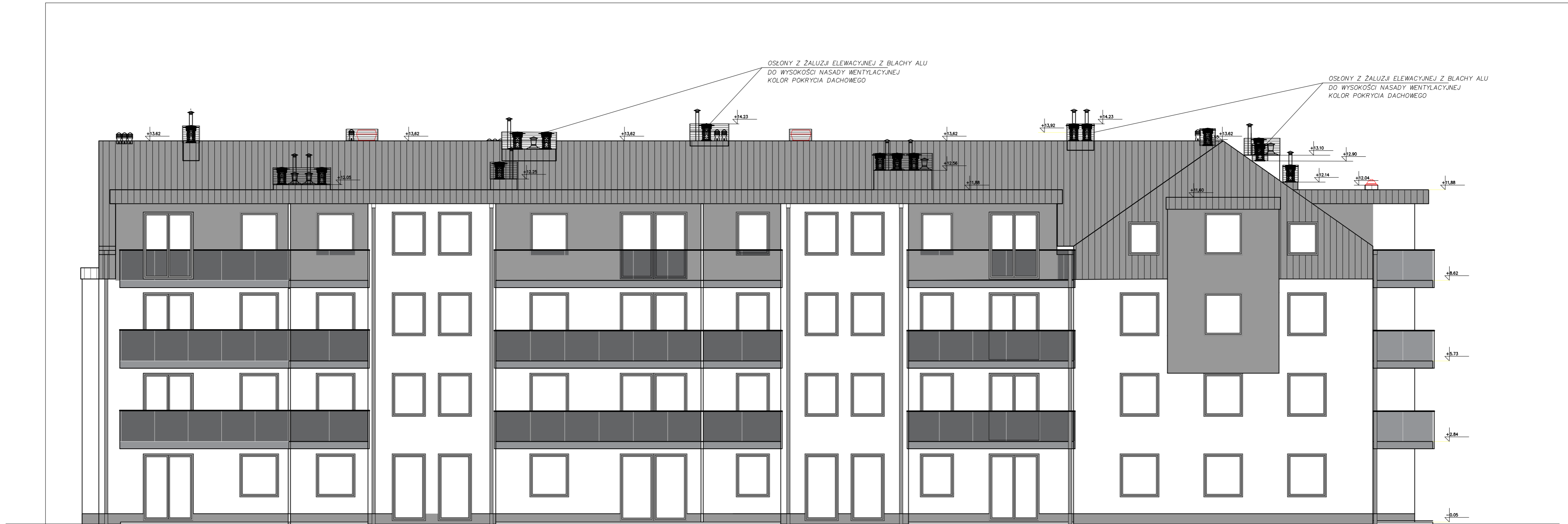
ELEWACJA PD - ZACH.